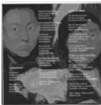
Asanaqigavit / Kærligst