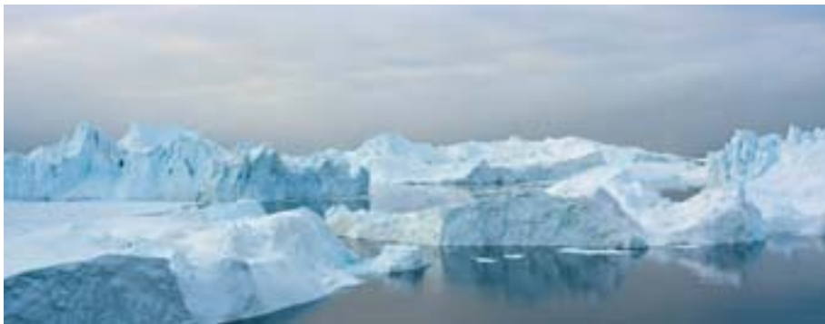
Ilulissat Ice Fjord, lokakuu 2005