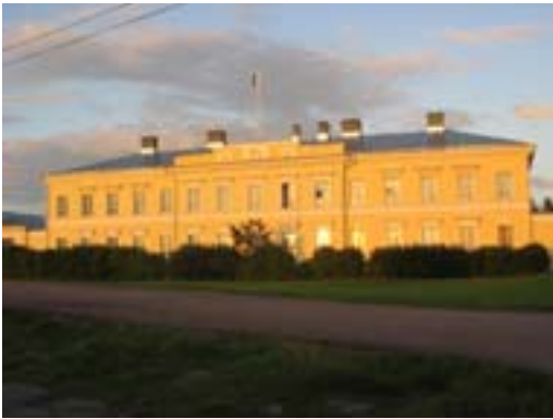
Eckerö post- och tullhus

(Bilderna är från utställningen på Åland Eckerö, tagna av Aira-Liisa Roiha kuvat näyttelys