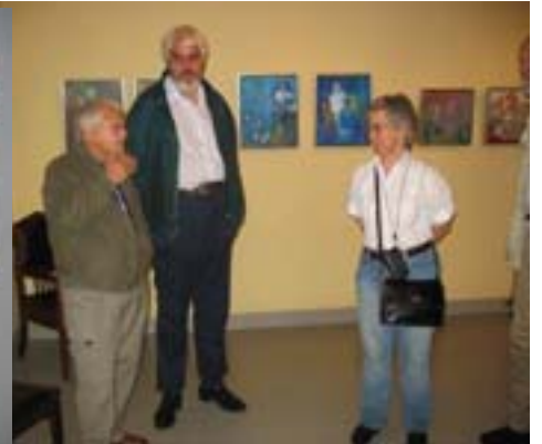
Gästerna från Sverige diskuterar med aaju Vieraat Ruotsista keskustelevat aajun kanssa