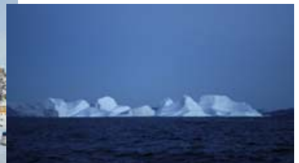
Uummannaq, huhtikuu 2006

Lehden ovat toimittaneet Tidningen har redigerats av