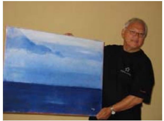
aaju förevisar en av sina tavlor /yksi aajun tauluista

(Bilderna är från utställningen på Åland Eckerö, tagna av Aira-Liisa Roiha kuvat näyttelys