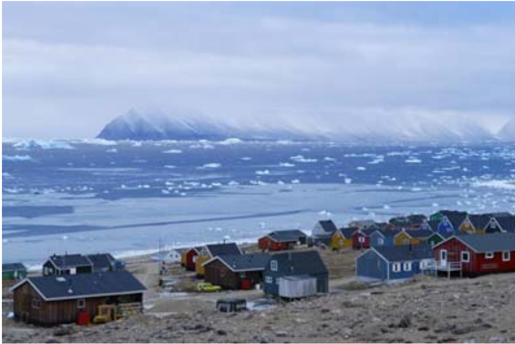
Qaanaq syyskuussa