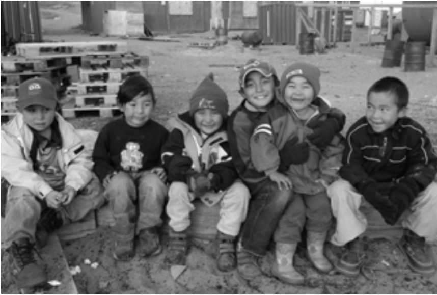
Lapset Siorapalukissa

Syksy vei minut Grönlantiin nauttimaan hiljaisuudesta. Vietin 6 viikkoa Pohjois-Grönlannin Qaanaaqissa ja Siorapalukissa ja kolme viikkoa Länsi-Grönlannin Ilulissatissa ja Uummannaqissa.