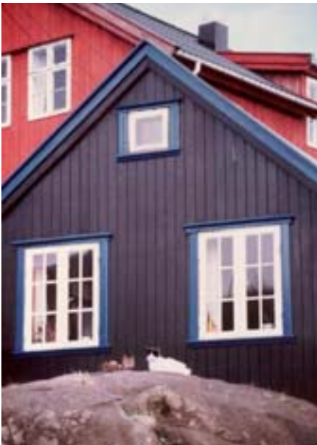
Kissat nauttivat kalliolla (Kuvat kirjasta "Kissat kertovat" kuva Sinikka Salokorpi)